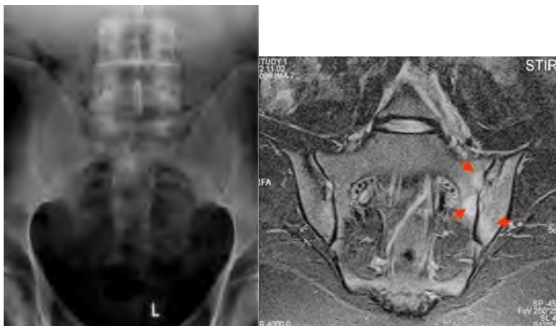
Рис. 1. Рентгенограмма таза (слева) и МРТ больного

При обследовании выявлен HLA-B27, признаки 2-стороннего сакроилита на рентгенограммах и активного воспаления на МРТ. Поставлен диагноз: анкилозирующий спондилит HLA-B27-позитивный, развернутая стадия, периферический артрит, энтезит, активность высокая.